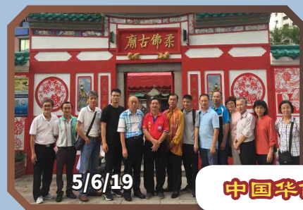
中国华侨大学学者