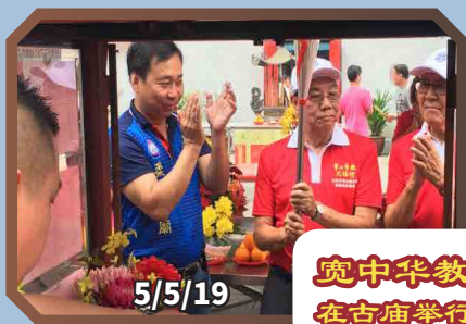
宽中华教火炬接力行 在古庙举行点燃火炬仪式