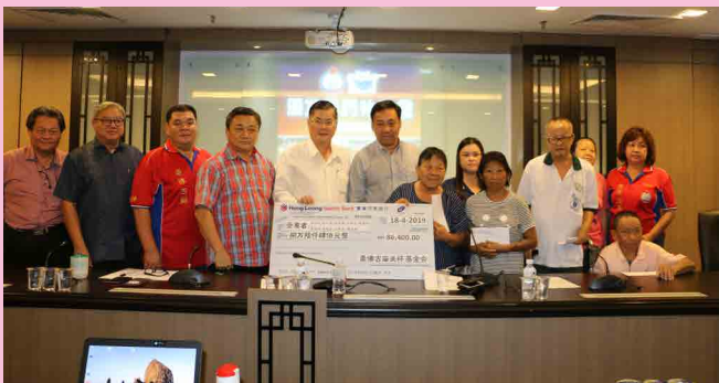
发放医药补助金仪式（4月18日）。