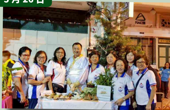
参与文工组举办的粽乐飘香庆端午