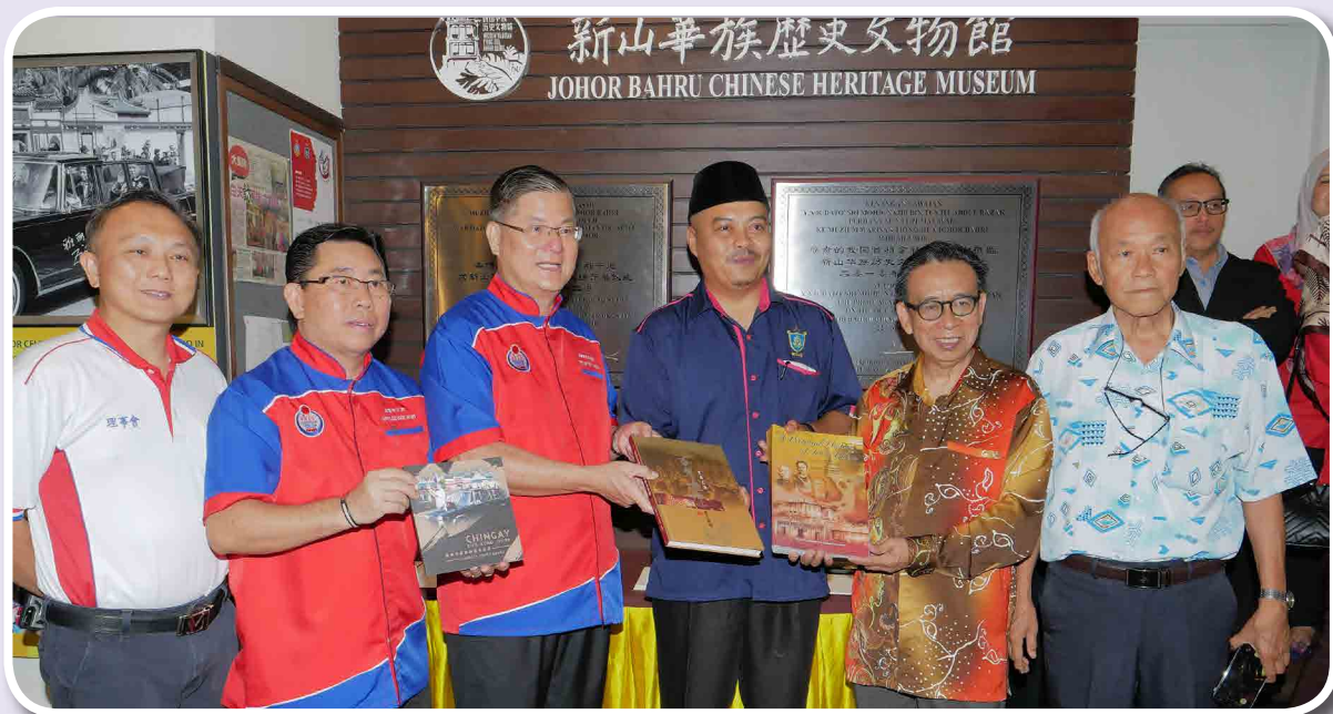
本会领导层以及管委与皇家博物馆嘉宾进行纪念品交换仪式