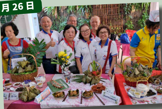
参与西北区举办的五福粽香庆端午