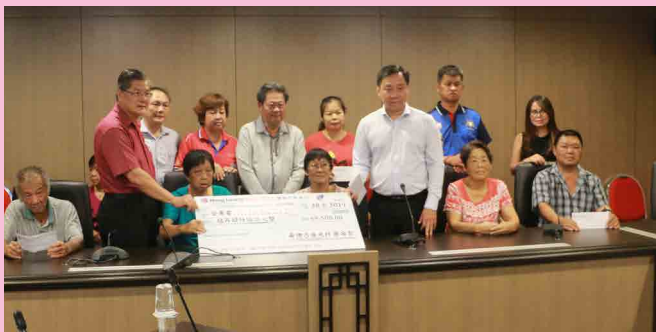
发放医药补助金仪式（6月28日）。